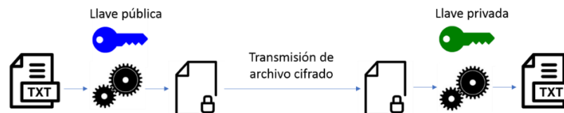
Figura 1. Esquema de transmisión de archivo plano cifrado.

En la transferencia de la información se utilizará cifrado asimétrico, asignándose una llave pública a la entidad financiera (ver figura 1). La llave pública estará disponible cuando se acceda al SSERIF.